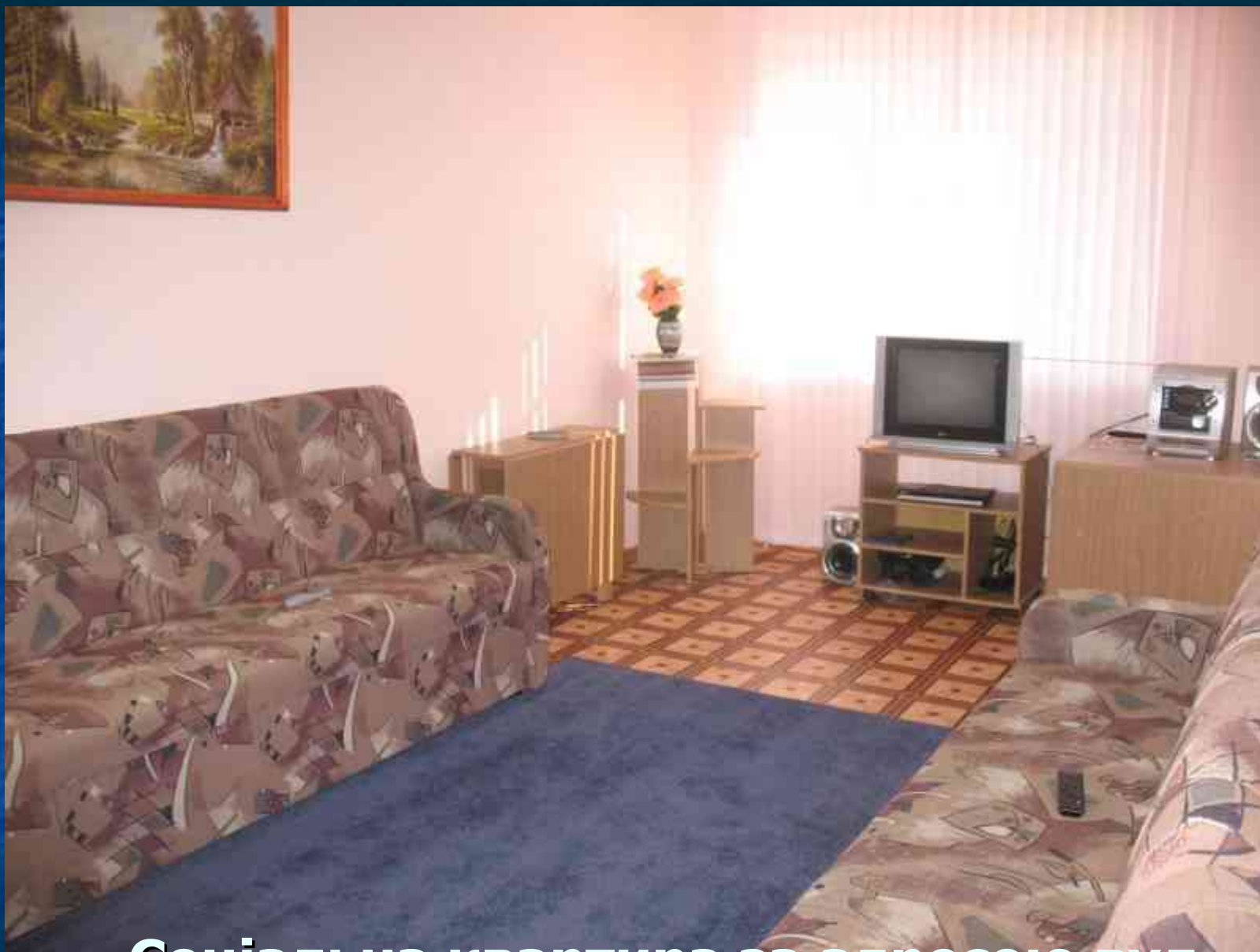
Соціальна квартира за адресою вул. Авангардна, 43-А