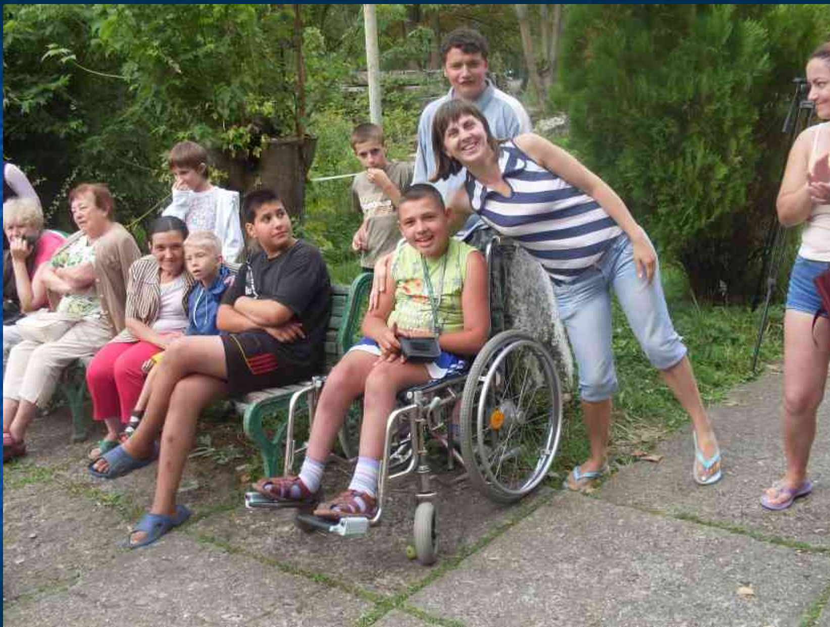
Відпочинок в санаторії "Зелені пагорби"