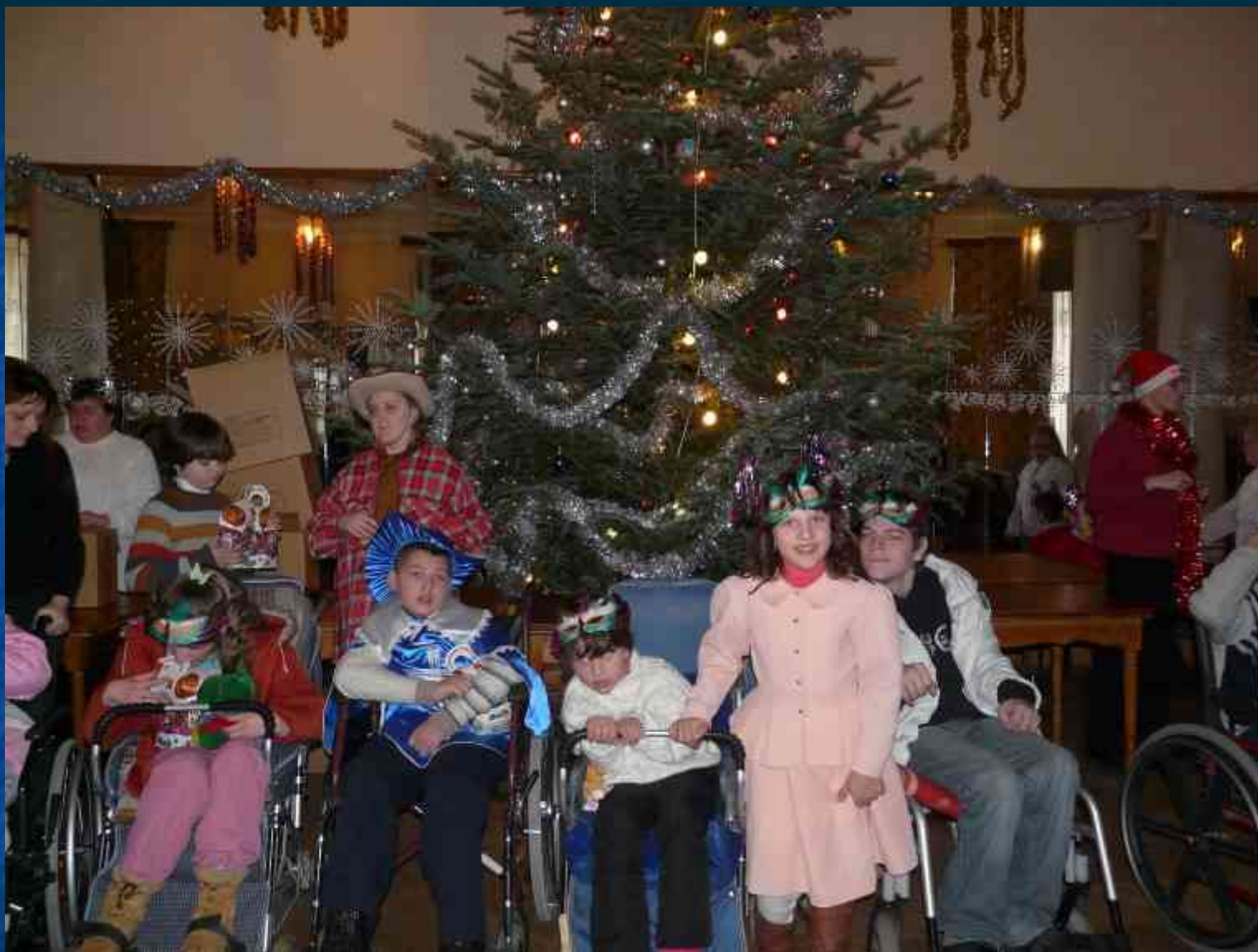
Новорічний ранок для дітей учасників клубу “Паросток”