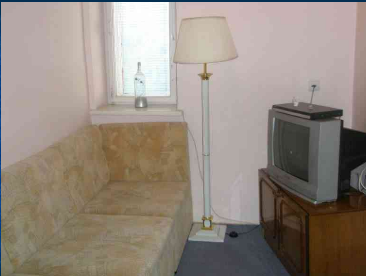
Соціальна квартира вул. Садова, 24/5