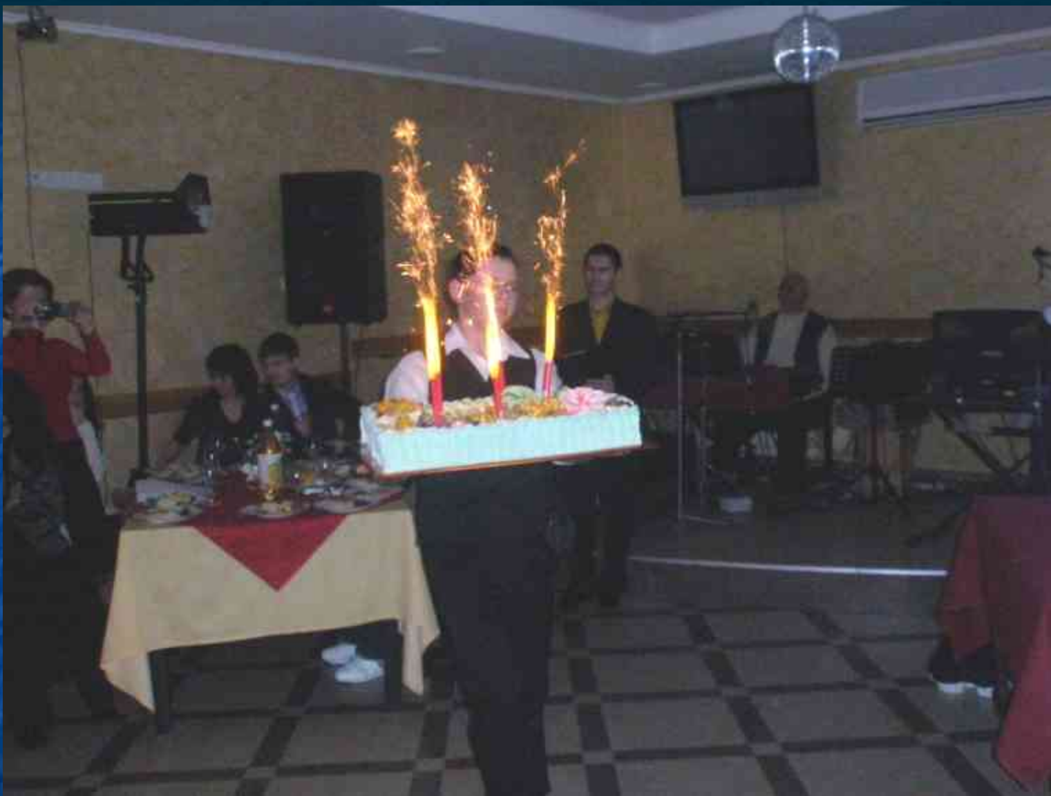
Святкування 5-річчя клубу "Паросток"