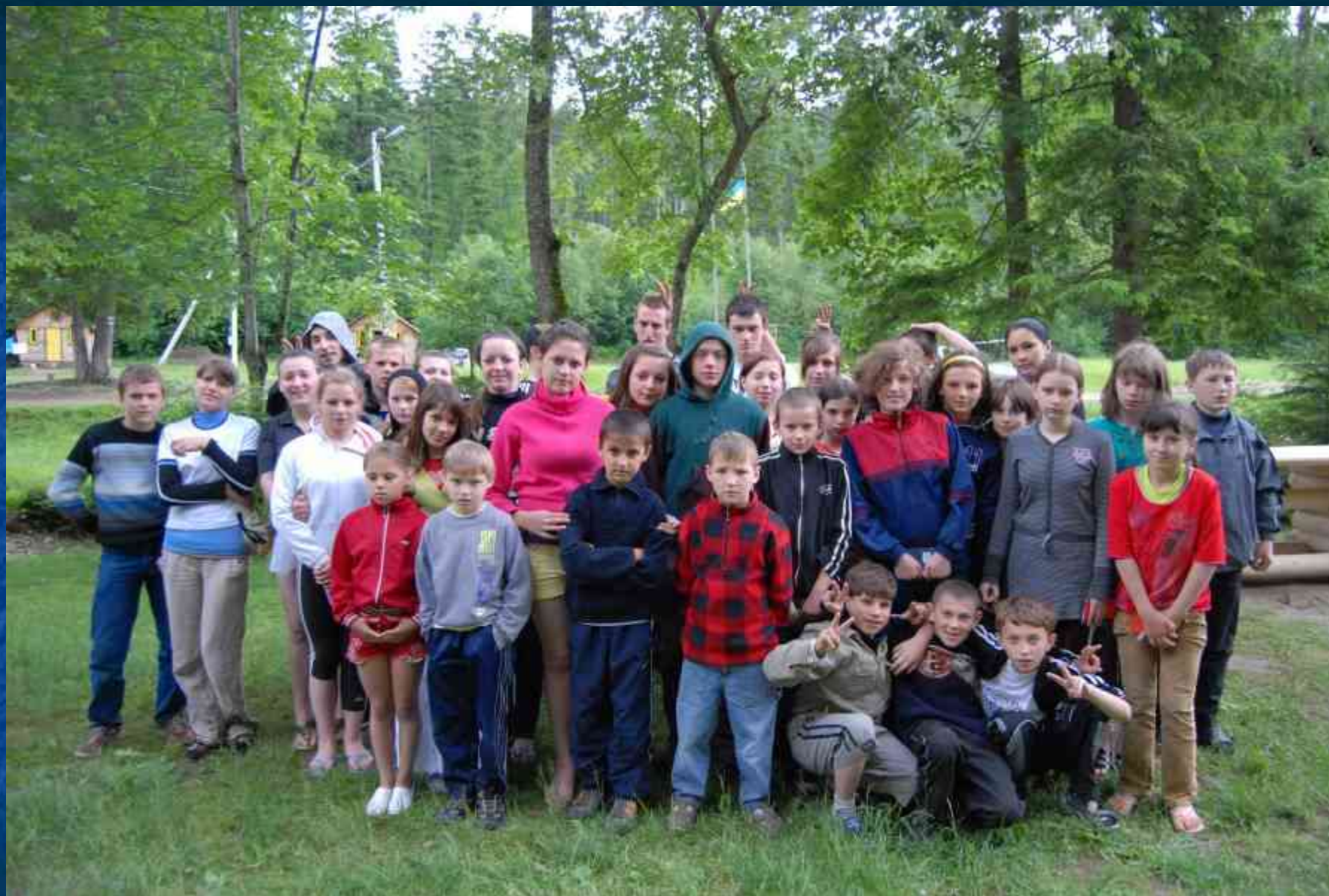
Учні школи – інтернату №2