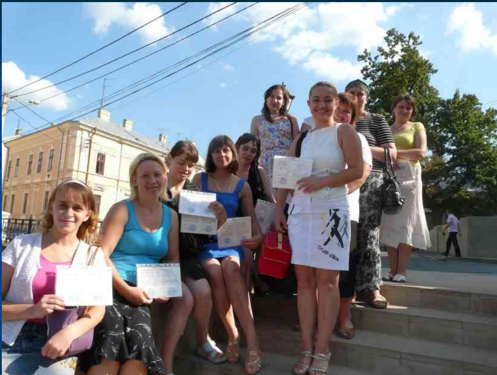
Учасники клубу "Паросток" з свідоцтвами про закінчення курсів молодших медсестер та масажу