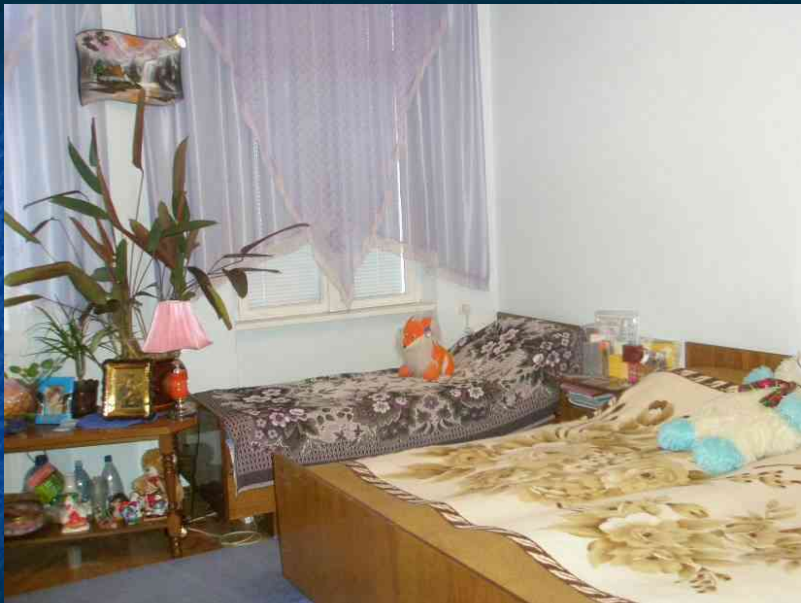
Соціальна квартира вул. Садова, 24/5