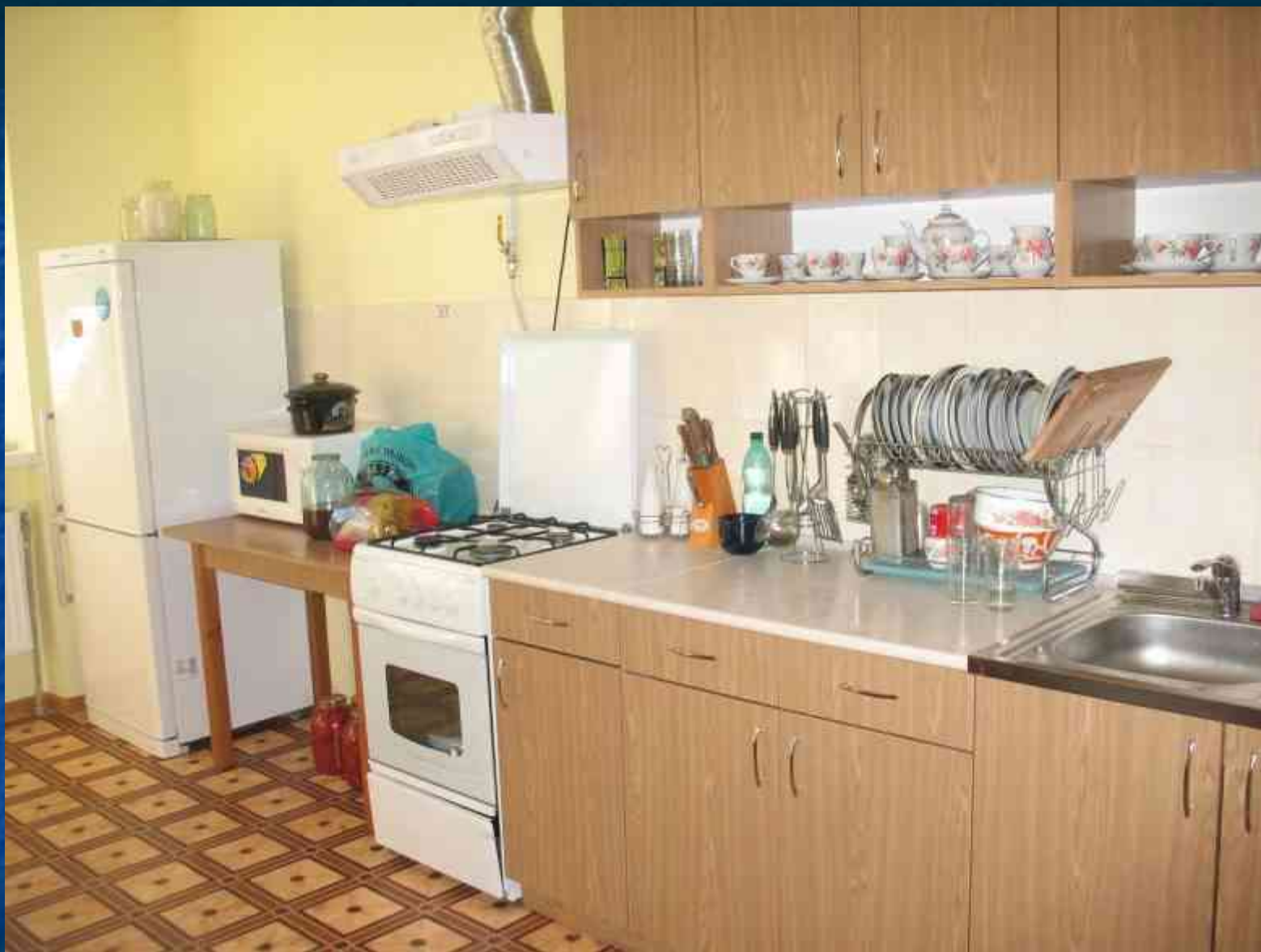
Соціальна квартира за адресою вул. Авангардна, 43-А