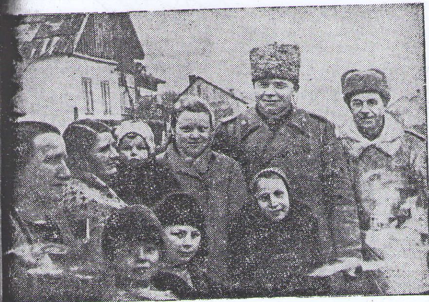
Радю зустріли чернівчани генерал-лейтенанта танкових військ А. Л. Гетьмана, війська якого звільняли Буковину.

У ці дні, коли трудящі Буковини натхненною працею зустрічають першу весну семирічки і перетворюють в життя велику програму XXI з'їзду КПРС, з хвилюванням згадується, як 15 років тому буковинці зустрічали іншу весну, тривожну, неспокійну, але так само повну радісних сподівань. То була весна 1944 року, року вирішальних перемог Радянської Армії у Великій Вітчизняній війні. Вже розгромлений ворог під Ленінградом і Новгородом, знищені десятки дивізій у Корсунь-Шевченківському «котлі», широко розгортався наступ на правобережний Україні.