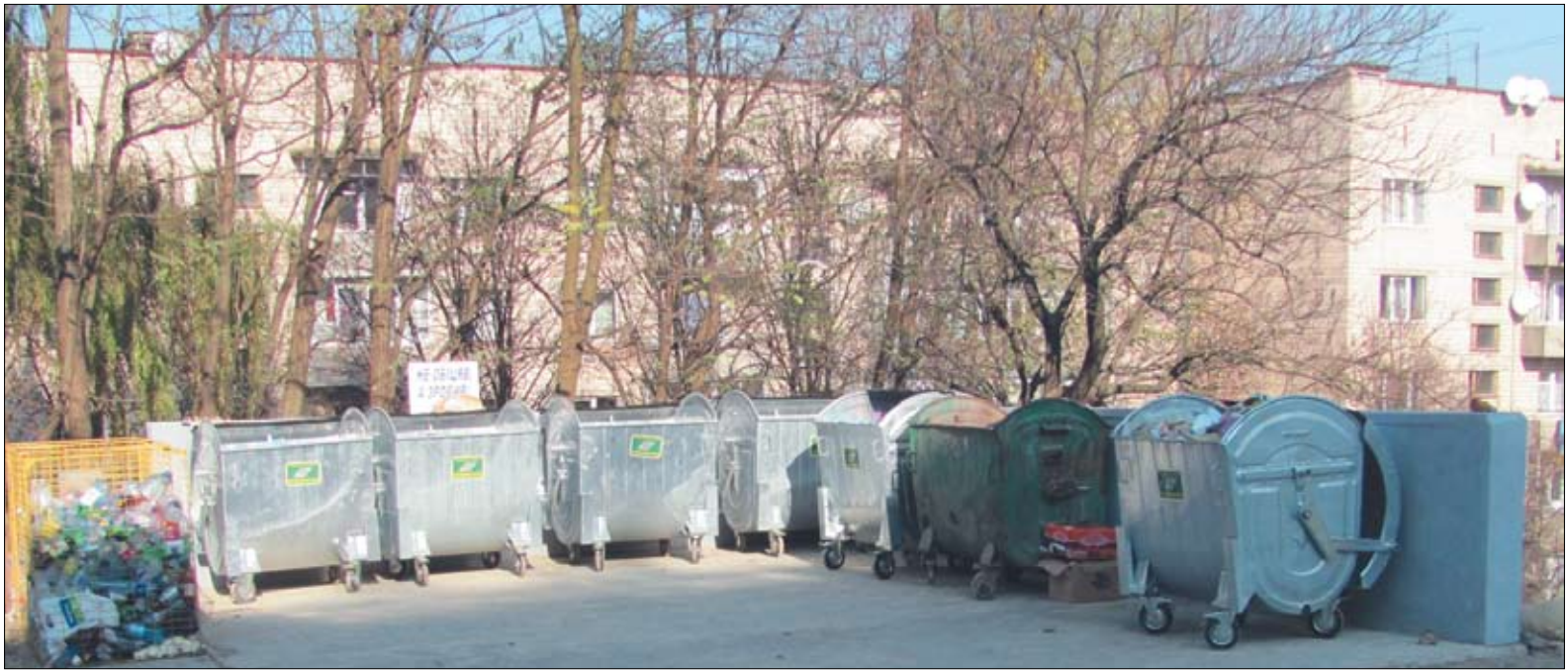
Відновлений майданчик для збору сміття в провулку Узбецькому, жовтень 2011 року