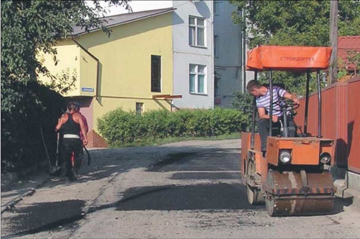
Поточний ремонт дороги на вул. Білоруській, серпень 2011 рік