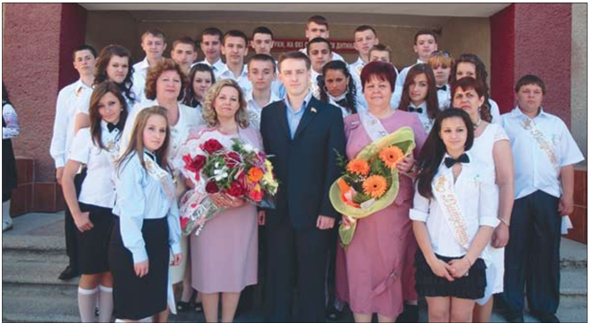
Останній дзвоник в ЗОШ №16, травень 2011 рік

❑ Ініційовано проведення трьох засідань комісії за участі керівників облдержадміністрації, міської ради, районної в місті ради та підрядних організацій з метою пошуку фінансування для завершення будівництва дренажу (водовідведення) з вулиць Жванецької, Кобзарської, Дундича. У зв'язку із тим, що з державного бюджету кошти на зазначені роботи в 2010-2011 роках не виділялись, добився включення в міський бюджет на 2012 рік на зазначені роботи 300 тис.грн.