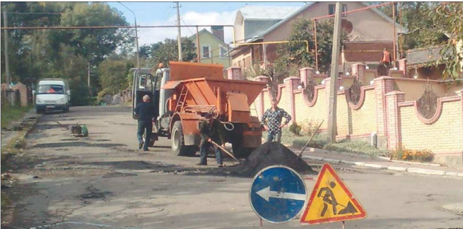
Поточний ремонт дороги на вул. Старокостянтинівській, жовтень 2011 рік

□ Проведено асфальтування – капітальний ремонт дороги вул. Фастівської біля автостанції. Також проведено поточний (ямковий) ремонт асфальтного покриття дороги на вулиці Старокостянтинівській, в тому числі за дольової участі ПП Гуцуляка А.М.